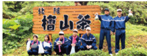
■ ネット販売(檜山茶)