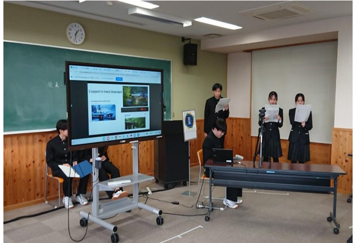
能代松陽 A 班の発表の様子

交流会は、各学校の研究発表が英語で行われ、その後、発表を聞いた他校の生徒からの質疑応答があり、さらに、それに対して即興で英語で答えるという形式で行われ、日頃の英語学習の成果を発揮して、非常に高いレベルのやり取りが見られました。