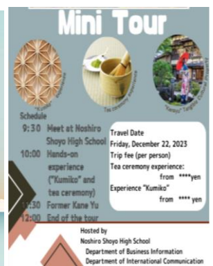
試行版ミニツアーポスター