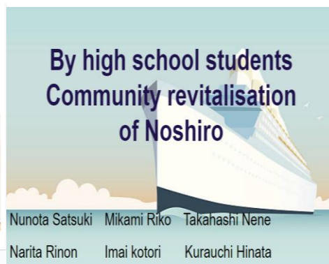
能代松陽 B スライド