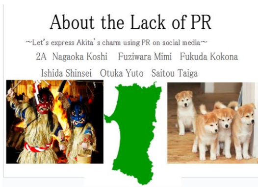
能代松陽 A スライド