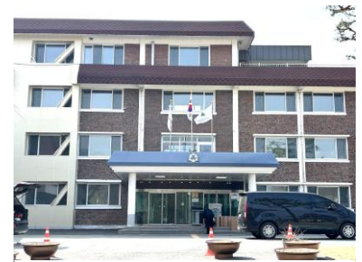
韓国・石正女子高校 校舎

9月10日から4泊5日の日程で、本校で初めての韓国語学研修を実施します。4月に参加希望者を募集し、今年度は13名の生徒が参加することになりました。2日目には本校と長く交流している石正 (ソクチョン) 女子高校を訪問し、現地の高校生と交流したりホームステイを体験する予定です。また石正女子高校の生徒と一緒にソウル市内でグループ別研修を行うほか、歴史的名所の訪問・公演鑑賞なども計画しています。