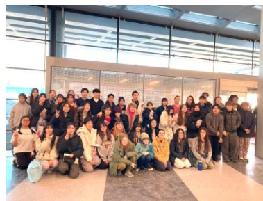
米国語学研修 帰国時の空港で

今年度もこのようにさまざまな国際理解、国際交流の行事が予定されています。本校の教育理念、目指す生徒像にもあるとおり、視野を世界に広げて未来を切り拓く力を身に付けた松陽生を目指していきましょう。